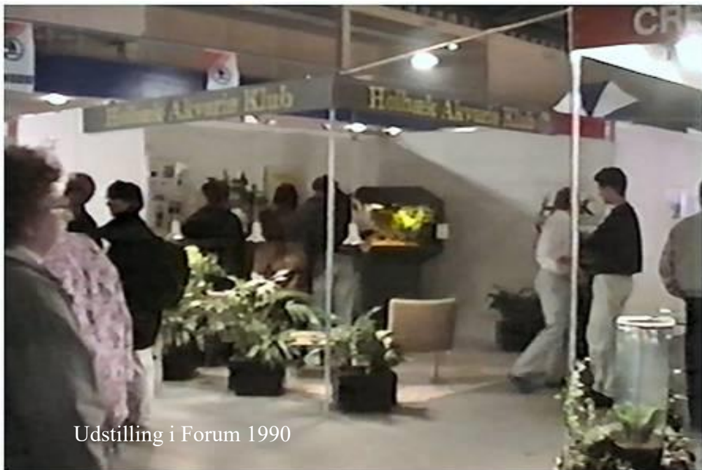
Udstilling i Forum 1990

Men her, kære læser, kommer den første af de ialt tre solstrålehistorier i denne fortælling. En af udstillerne fra Lyngby Akvarieforening kom tilfældigt forbi og så mine anstrengelser med filteret og tilbød med det samme, at jeg måtte låne et indvendigt filter af ham, så jeg kunne få klaret vandet. Filteret kom på plads og fungerede fint, så jeg regnede med, at når jeg kom igen næste dag med et nyt filter og fisk, så var alle mine problemer forbi. Ak -ja.