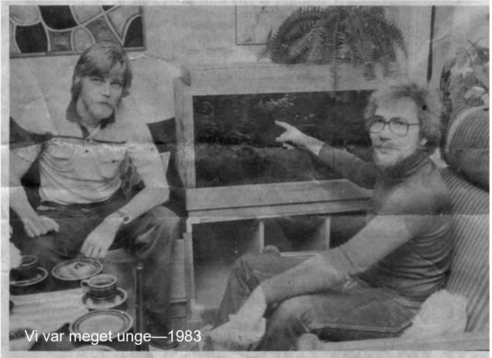
Vi var meget unge—1983

Vi spredtes i døren for alle vinde, hver til sit akvarium. Jeg fandt hurtigt hen til mit, der godt nok stod vældigt pænt og præsentabelt - men ak og ve.!!!!