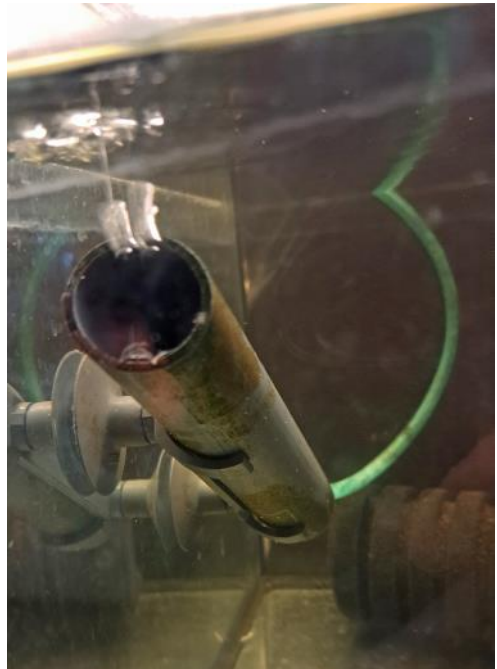
Gyderøret monteret med luftslange