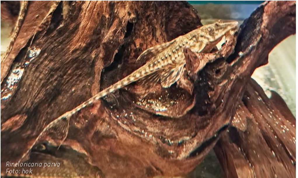
Rineloricaria parva