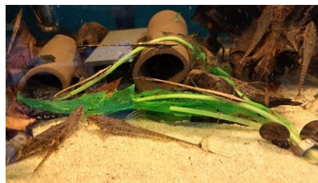
Falowella og Rinoloricaria unger

De er fortræffelige til diverse grøntspisende maller.